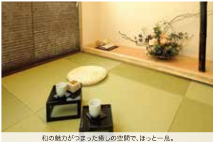
和の魅力が詰まった癒しの空間で、ほっと一息。