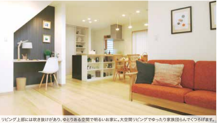
リビング上部には吹き抜けがあり、ゆとりある空間で明るいお家に。大空間リビングでゆったり家族団らんできつるげます。