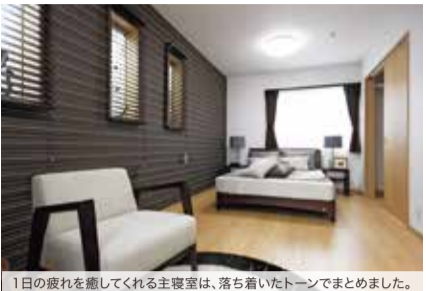
1日の疲れを癒してくれる主寝室は、落ち着いたトーンでまとめました。