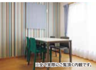
※全て実際にご覧頂く内観です。

洗う・干す・しまう・着るを同じ所で できちゃう万能空間。洗濯した衣類を すぐに干せてしまえます。