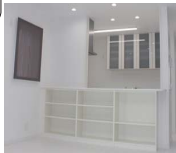
お子様が勉強できる、キッチンカウンター

土地 114.03 m 2 (34.49 坪) 都市計画：市街化区域 建物 81.97 m 2 (24.79 坪) 用途地域：第 1 種低層住専 別地下室あり 12.42 m 2 建ぺい率：50% 容積率：80% 3LDK 平成 27 年 12 月完成 木造 2 階建 交通：田上台地中央バス停 歩 1 分 【売主】 リビングエアコン / カーテン / LED 照明 / 外構付