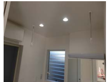
雨の日も安心の室内物干し